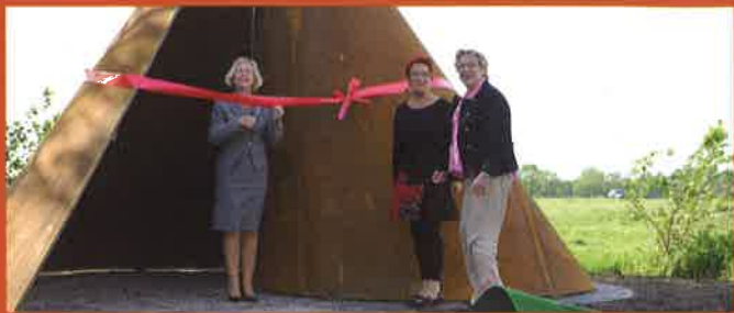
Bundesbildungsministerin Frau Prof. Dr. Wanka bei der Eröffnung des Salz-Torf-Kegels