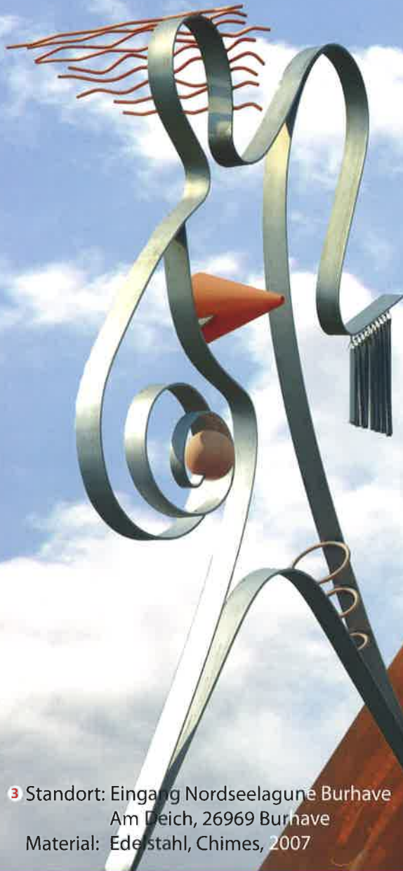
3 Standort: Eingang Nordseelagune Burhave Am Deich, 26969 Burhave Material: Edelstahl, Chimes, 2007

Man hört sie sie lockt sie verführt die Grabenhexe die Wassernixe Die Mettje