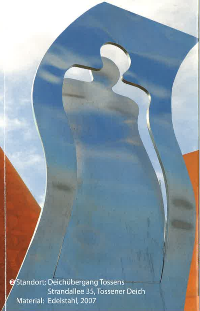
2 Standort: Deichübergang Tossens Strandallee 35, Tossener Deich Material: Edelstahl, 2007

Er kommt mit Macht verborgen im Wellenschlag überrascht er uns der Sturm die Flut die Sturmflut Der Blanke Hans